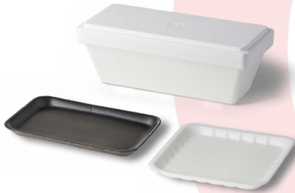
حاويات الطعام/المشروبات المصنوعة من البوليسترين الممدد