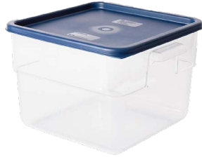
حاويات تخزين الطعام متعددة الاستخدامات