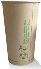
حاويات المشروبات المرخصة القابلة للتحلل