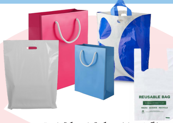
الأكياس البلاستيكية السمكية التي تستخدم في السوبر ماركت أو محلات الألبسة