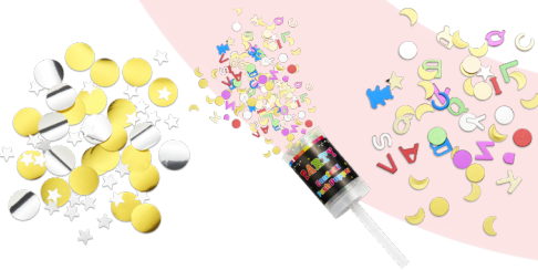
قصاصات الورق الملون البلاستيكية