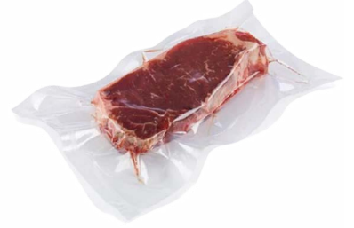
أغلفة الطعام محكمة الغلق المفرغة من الهواء