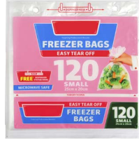
حزم الأكياس البلاستيكية التي تباع على رفوف المتاجر