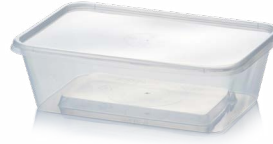
حاويات الأطعمة الجاهزة المربعة/المستطيلة الشكل *