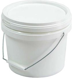
حاويات تحضير الطعام في أماكن العمل