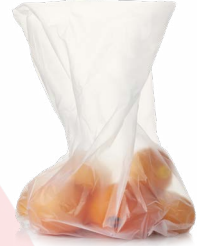
الأكياس البلاستيكية أحادية الاستخدام