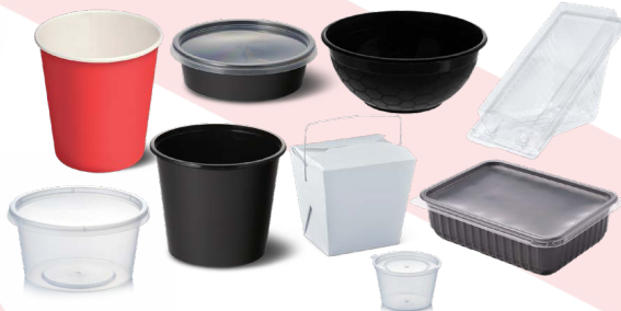
حاويات الطعام البلاستيكية أحادية الاستخدام وأغطيتها