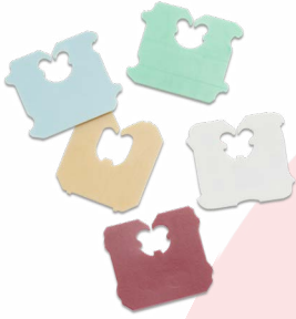
أربطة أكياس الطعام البلاستيكية

سيتم حظر بيع هذه المنتجات وتزويدها وتوزيعها اعتبارًا من 1 أيلول/سبتمبر 2024