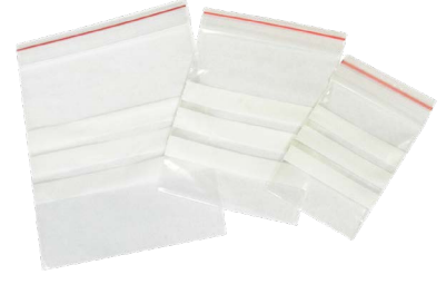
الأكياس البلاستيكية التي تغلق بسحاب