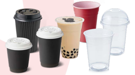
حاويات المشروبات البلاستيكية أحادية الاستخدام وأغطيتها (بما في ذلك أكواب القهوة)