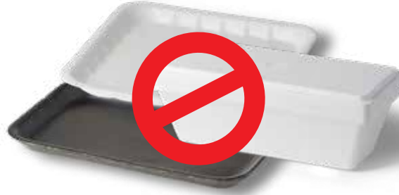
अन्य ईपीएस खाद्य / पेय कंटेनर