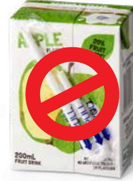
प्लास्टिक अटैचमेंट के साथ पहले से पैक किए गए उत्पाद