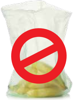
प्लास्टिक के उत्पाद थैले