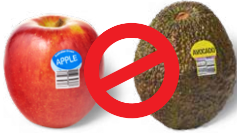
प्लास्टिक के फलों के स्टिकर