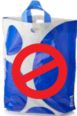
मोटे प्लास्टिक बैग