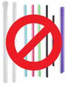
एकल-उपयोग प्लास्टिक स्ट्रॉ