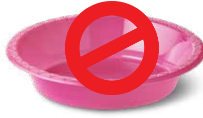
एकल-उपयोग प्लास्टिक कटोरे