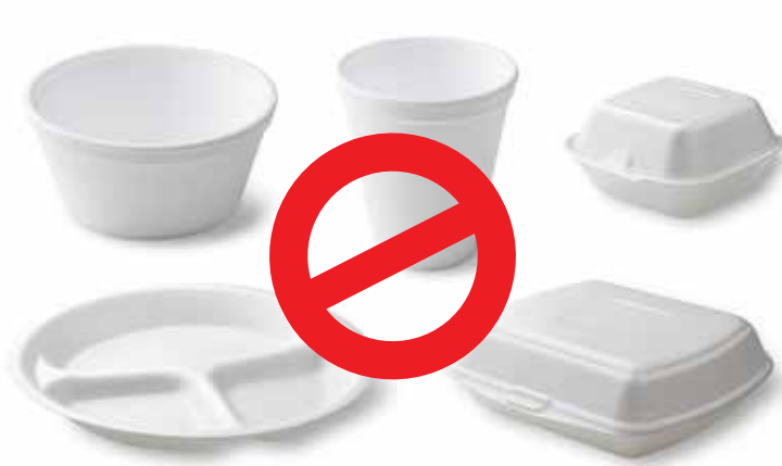
विस्तारित पॉलीस्टाइनिन कप, कटोरे, प्लेटें और क्लैमशेल कंटेनर