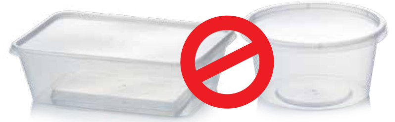
एकल-उपयोग प्लास्टिक खाद्य कंटेनर

अधिक जानकारी के लिए replacethewaste.sa.gov.au पर जाएँ