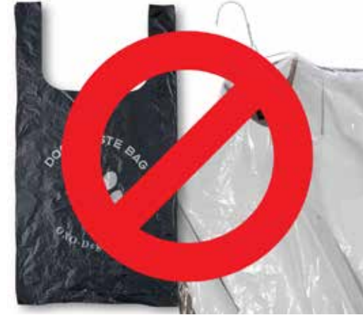
ऑक्सो-डिग्रेडेबल प्लास्टिक उत्पाद