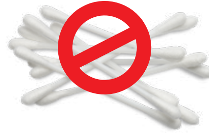
प्लास्टिक की डंडियों वाले कॉटन बड्स