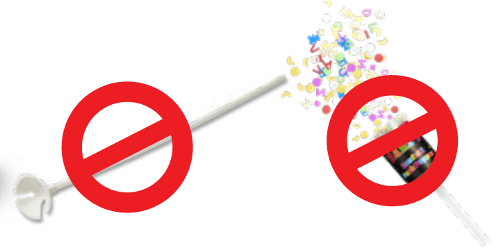
प्लास्टिक बैलून स्टिक/टाई