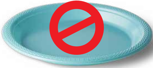
एकल-उपयोग प्लास्टिक प्लेट्स