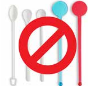
एकल-उपयोग प्लास्टिक स्टिरर्स