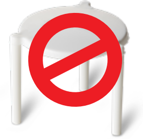
प्लास्टिक पिज्जा सेवर