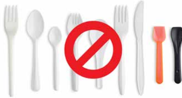
एकल-उपयोग प्लास्टिक कटलरी