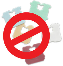
प्लास्टिक के ब्रेड टैग