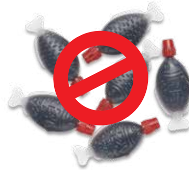
प्लास्टिक सोया मछली