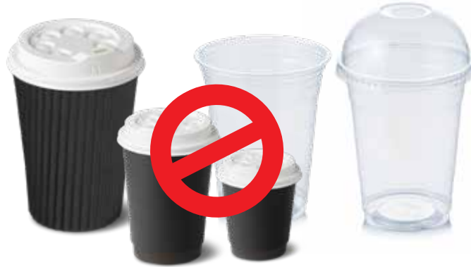
एकल-उपयोग प्लास्टिक पेय कंटेनर, ढक्कन और पेय प्लग (कॉफी कप सहित)